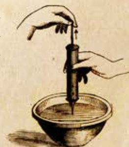
Fig. 120. — Le vaccin A, Fig. 121. — L'eau de la source, poussée par la pression atmosphérique, dans une seringue à oreilles.

«Le meurtre de Pasteur» est un scénario d'enquête qui plonge les participants dans la recherche scientifique des années 1880. Une ère où la raison triomphe de toutes les superstitions. Qui donc, parmi les quelques suspects présents au moment des faits, aurait pu vouloir du mal à l'illustre savant ?..