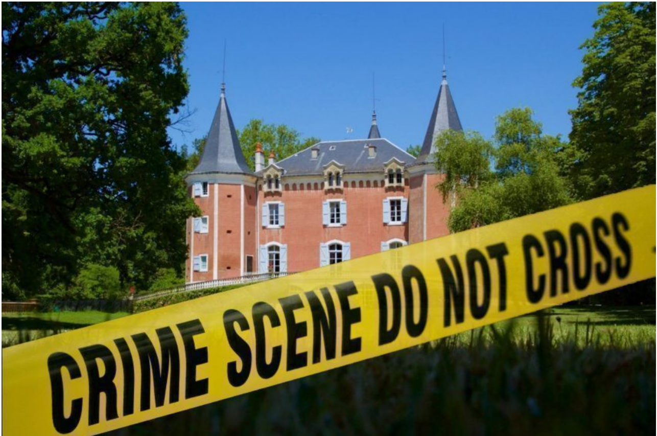
Le château de Garrevaques, dans le Tarn, organise des murder party pendant l'été.

Du 1 er au 12 juillet 2020, le château de Garrevaques , dans le Tarn , va accueillir les fans d'enquête policière en organisant des murder party. Dans une ambiance digne des meilleures séries policières, les participants devront élucider un crime, après avoir découvert un cadavre dans le parc de la propriété, situé à 45 minutes de Toulouse .