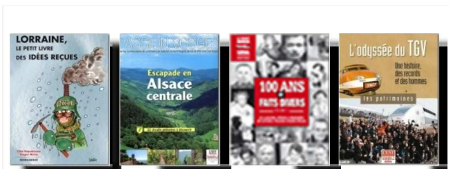
Les hors-séries et autres publications